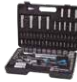
MALETÍN 94 STANDARD 1/4" Y 1/2"