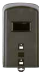
MÁSCARA DE SOLDADURA MANUAL C/ CRISTALES