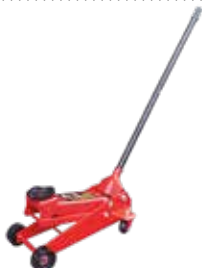
ELEVADOR HIDRAULICO 3 TON. Ref. 0940 0626