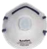
MASCARILLA PROTECCIÓN C/ VALVULA FFP2 Ref. 1100 0234