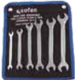
SET 8 PCS LLAVES FIJAS 6-7 A 20-22