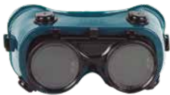
Gafas Soldador Ref. 1100 0022