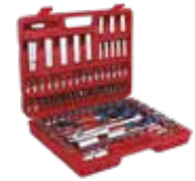
MALETÍN 108 PCS STANDARD 1/2" Y 1/4"