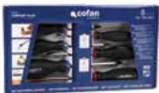
SET DESTORNILLADORES 6 PCS. SERIE 6000