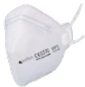
PACK 2 MASCARILLAS FFP2 NR AJUSTE EN CABEZA SIN VÁLVULA Ref. 1100 0420-U