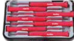
KIT DESTORNILLADOR PRECISION 7 UDS.