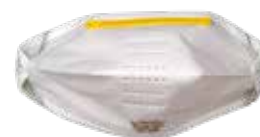
BLÍSTER DE MASCARILLA SIN VÁLVULA FFP1D UNITARIA Ref. 1100 0062-BL-U