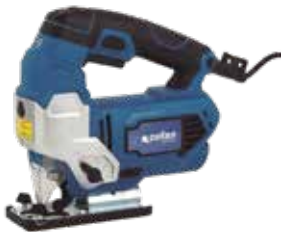
SIERRA DE CALAR ELECTRÓNICA 800W 0-45° (0-3000RPM) Ref. 5000 1225 63,60 €