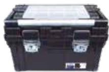
CAJA HERRAMIENTAS "HEAVY DUTY" NEGRO