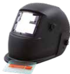
CASCO SOLDADURA AUTOMÁTICA (ARC/MIG/MAG/TIG)