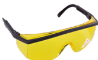
Gafas seguridad ultravioleta