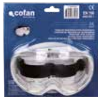
Blister Gafa Seguridad Visión Panorámica Ref. 1100 0027BL