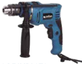
TALADRO DE IMPACTO 600W Ref. 5000 1235 34,40 €