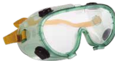
Gafas Seguridad Antivaho Ref. 1100 0020