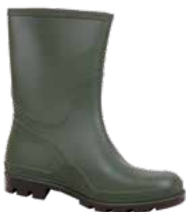
BOTA VERDE MEDIA CAÑA PVC VERDE Ref. 1200 20 + TALLA(36-47) 11,50 €