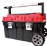
CAJA DE HERRAMIENTAS HEAVY DUTY C/ RUEDAS