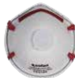
MASCARILLA PROTECCIÓN C/ VALVULA CE FFP3 Ref. 1100 0235