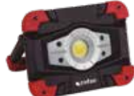
LUZ DE TRABAJO COB LED 10W 6500K USB