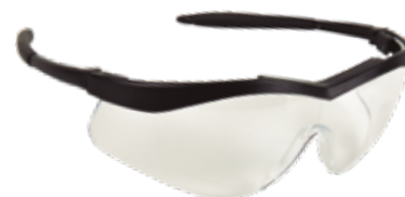
Gafas seguridad modelo eyes 2000