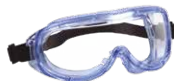
Gafa visión panorámica