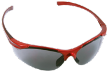
Gafa Seguridad Anatómica Ref. 1100 0321