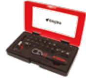
SET MINI CARRACA 1/4" CON PUNTAS (33 pcs.)