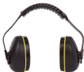
CASCO ANTIRUIDO CAT III CE SNR-32dB SUPER LIGERO