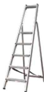
ESCALERA ALUMINIO SOLDADA 5 PELDAÑOS - REFORZADA Ref. 0940 1050