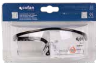
Blister gafas seguridad contraimpacto