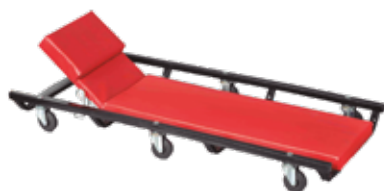
CAMILLA DE TRABAJO 40" (1030X440X110MM) Ref. 0940 0628