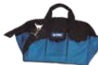
BOLSA HERRAMIENTAS 455X280X300 NYLON 60KG