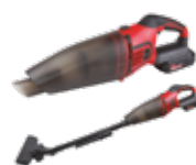
ASPIRADOR A BATERÍA CON BRAZO ARTICULADO LI-ION 18V