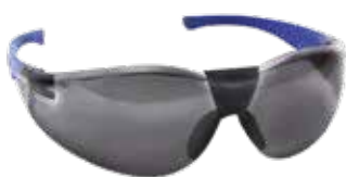
Gafas seguridad modelo blue elastic