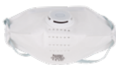
BLÍSTER DE MASCARILLA DE CARBONO FFP2D VENTA UNITARIA Ref. 1100 0061-BL-U