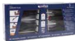
SET DESTORNILLADORES 5 PCS. SERIE 6000