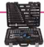
MALETÍN 218 PCS PROFESIONAL 1/2", 3/8" Y 1/4"