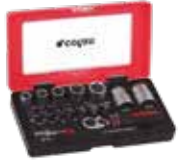
SET MINI CARRACA VASOS Y PUNTAS 1/4 (23 pcs.)