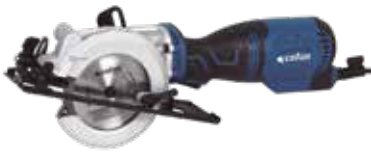
MINI SIERRA CIRCULAR ELÉCTRICA 705W - 115MM Ref. 5000 1231 76,35 €