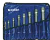
JUEGO DE 8 LLAVES DE TUBO