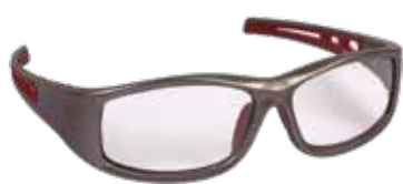
Gafas seguridad monofocal graduada 2,5 dioptrías