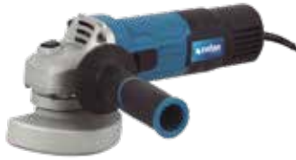
AMOLADORA VELOCIDAD VARIABLE 900W Ø 115/125MM Ref. 5000 1215 62,30 €