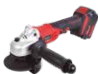
AMOLADORA A BATERÍA 8000RPM - 115MM LI-ION 18V