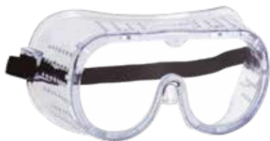
Gafa seguridad ventilación directa