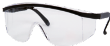
Gafas seguridad contraimpacto