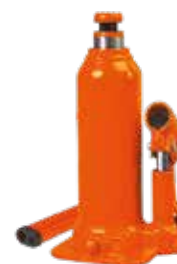
GATO HIDRAULICO BOTELLA 4 TON. Ref. 0940 0620