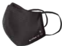
MASCARILLA TEXTIL NEGRA REUTILIZABLE (Adulto / niño) Ref. 1100 0415 / 1100 0415-N