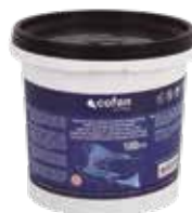
TOALLITAS PARA LIMPIEZA DE MANOS ANTIBACTERIAS 100 UDS. Ref. 1500 0082 32,75 €