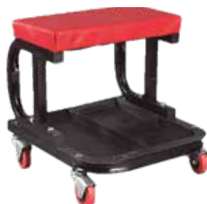
ASIENTO DE TRABAJO MÓVIL (395X390X140MM) Ref. 0940 0629