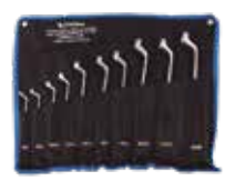
SET 8 PCS LLAVES ACODADAS DE 6-7 A 20-22