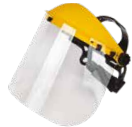
Pantalla Protección Transparente Ref. 1100 0031