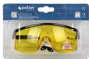
Blister gafas de seguridad ultravioleta