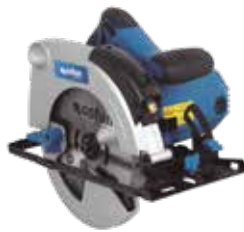
SIERRA CIRCULAR CON LÁSER EXTERNO 1550W Ø185MM Ref. 5000 1210 97,45 €