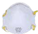
SET DE 3 MASCARILLAS S/ VÁLVULA FFP1D Ref. 1100 0101BL