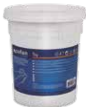
PASTA LAVAMANOS CON PARTÍCULAS 1KG Ref. 1500 0020 3,95 €