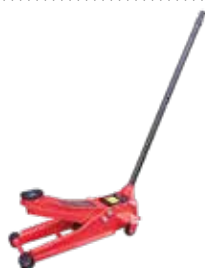
ELEVADOR HIDRAULICO 2,5 TON. Ref. 0940 0627

Cámara de Inspección con TFT/ LCD color, con medida 2.4". Dispone de luz en el extremo de la cámara, protección IP 67 y conexión por cable para TV.