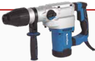
★ 206,80 € TALADRO MARTILLO PERFORADOR 1500W - SDS MAX Ref. 5000 1232