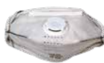
BLÍSTER DE MASCARILLA DE CARBONO FFP2D VENTA UNITARIA Ref. 1100 0063-BL-U