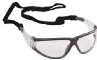
Gafas Seguridad Envolverte UV Protection Ref. 1100 0394