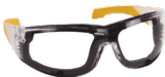
Gafa seguridad acolchada foam