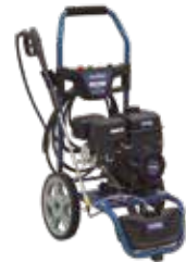
LIMPIADORA ALTA PRESIÓN 210CC MODELO MICHIGAN PISTOLA PRO. Ref. 7100 1015 547,55 €