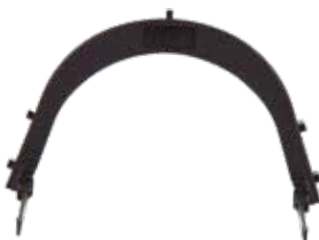
SOPORTE CASCO OBRA PARA MALLA PROTECTOR