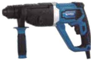
TALADRO MARTILLO PERFORADOR SDS PLUS 1050W Ref. 5000 1223 139,99 €