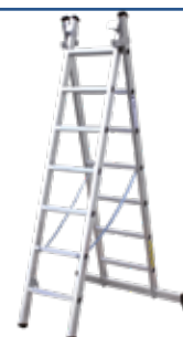
ESCALERA ALUMINIO DOBLE 7 PELDAÑOS 2,00+2,00 MTS Ref. 0940 1010