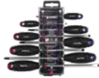
DISPLAY DESTORNILLADORES PLANO-PHILLIPS 8 PCS