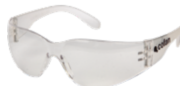
Gafas seguridad UV protection