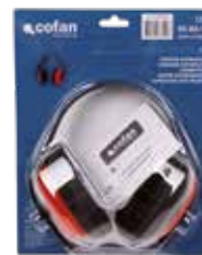
BLISTER AURICULARES DE PROTECCIÓN SNR-27dB