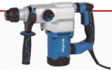
★ 148,15 € TALADRO MARTILLO PERFORADOR 1500W - SDS PLUS Ref. 5000 1233