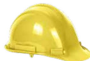
CASCO INGENIERO C/ REGULADOR