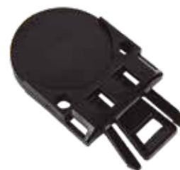
SOPORTE SUJECCIÓN PORTA-VISERA