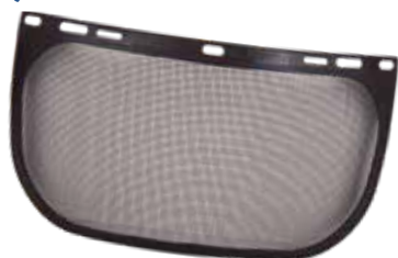
PANTALLA PROTECCIÓN REJILLA 310X200 MM