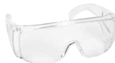
Gafas seguridad modelo typical