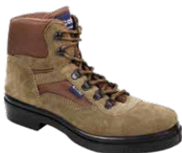
BOTA TREKKING VERDE MODELO ALHAMA Ref. 1250 33 + TALLA(39-46) 35,20 €