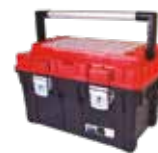
CAJA DE HERRAMIENTAS "HEAVY DUTY" NEGRO/ROJO