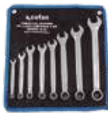
SET 8 PCS LLAVES COMBINADAS DE 8 A 22