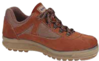
ZAPATILLAS TREKKING MODELO IREGUA Ref. 1250 26 + TALLA(38-46) 41,90 €