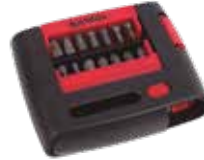
SET PUNTAS PH, TORX, SL, HEX (27 pcs.)