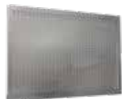
PANEL PORTA HERRAMIENTAS DE ACERO 1,5 METROS