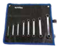
SET 8 LLAVES DE ETRELLA PLANA