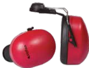
CASCO ANTIRUIDO SNR-25.9 dB P/ CASCO OBRA