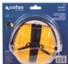
BLISTER AURICULARES DE PROTECCIÓN SNR-30dB