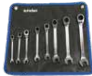
SET 8 LLAVES DE CARRACA MIXTA