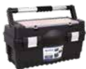
CAJA HERRAMIENTAS "MODELO BRINELL" 547X271X278