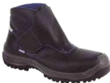
BOTA PIEL NEGRA CIERRE VELCRO S-3 MODELO URIAN Ref. 1200 45 + TALLA(36-47) 36,55 €