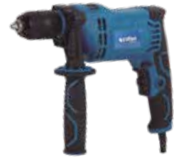
TALADRO IMPACTO 910W (1-13mm) PORTABROCAS AUTOMÁTICO Ref. 5000 1220 60,65 €