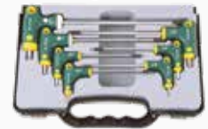
SET DESTORNILLADOR "T" 7PCS TORX