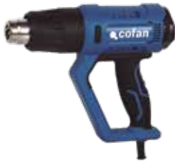
PISTOLA DE AIRE CALIENTE LCD DIGITAL DISPLAY 2000W Ref. 5000 1234 70,90 €