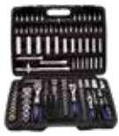
MALETÍN 171 PCS PROFESIONAL 1/2", 3/8" Y 1/4"