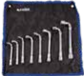
SET 10 LLAVES DE PIPA