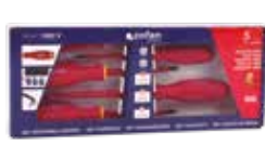
SET 5 DESTORNILLADORES 1000V