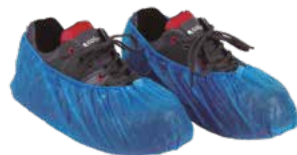
CUBREZAPATO AZUL CPE Ref. 1100 0209 0,15 €