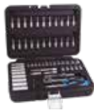
MALETÍN 57 PCS PROFESIONAL VASOS Y PUNTAS 1/4"