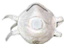
BLÍSTER DE MASCARILLA CON VÁLVULA FFP2D VENTA UNITARIA Ref. 1100 0103