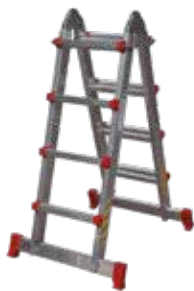
ESCALERA ALUMINIO MULTIPOSICIÓN 4X4 PELDAÑOS Y 3,83 MTS Ref. 0940 1070