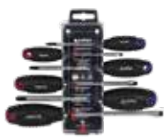
DISPLAY DESTORNILLADORES PLANO-PHILLIPS 6 PCS.