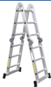
ESCALERA ALUMINIO MULTIPOSICIÓN 4X3 PELDAÑOS Y 3,25 MTS Ref. 0940 1060