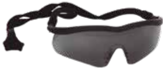
Gafas Seguridad Sport Oscura UV Protection Ref. 1100 0393