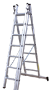
ESCALERA ALUMINIO TRIPLE 7 PELDAÑOS 2,00+2,00+2,00 MTS Ref. 0940 1020