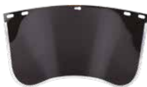
Plástico Protector Oscuro 400 MM. Ref. 1100 0195

Gafas Polarizadas de Seguridad Modelo Sport working. EN 166. Testadas en UV. Máxima protección a reflejos, sol y destellos.