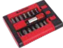
SET PUNTAS ADAPTADOR PH, PZ, TORX, SL (15 pcs.)