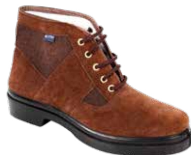
BOTA SERRAJE/LONA MODELO MANGLAR Ref. 1250 22 + TALLA(39-46) 18,90 €